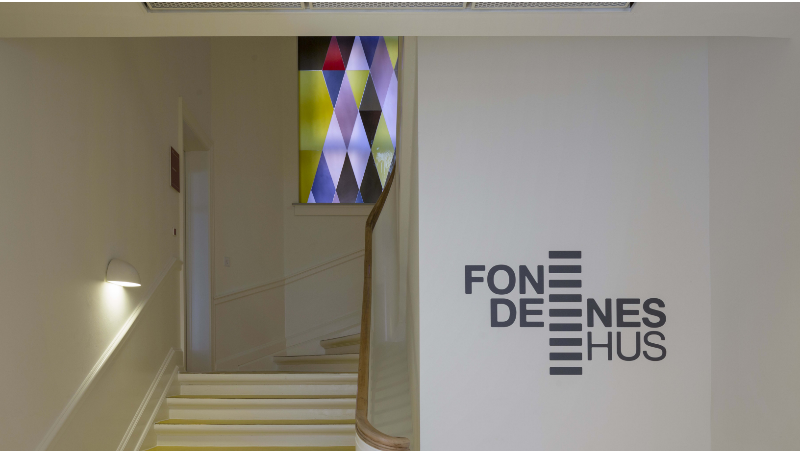
Fondenes Hus, Foto: Malene Landgren