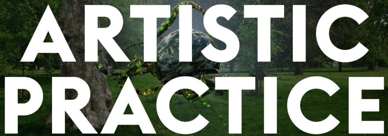
Foto: Jakob Kudsk Steensen, 'The Deep Listener', The Serpentine Galleries