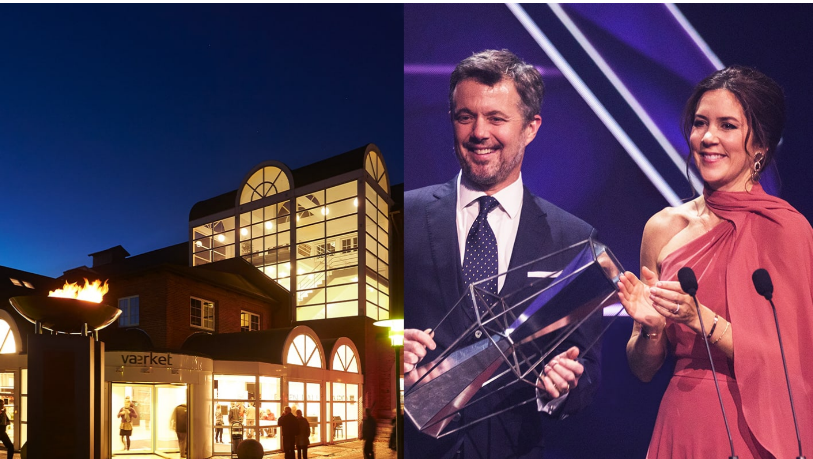
Kronprinsparrets Priser 2020, Foto: Værket / Ulrik Jantzen