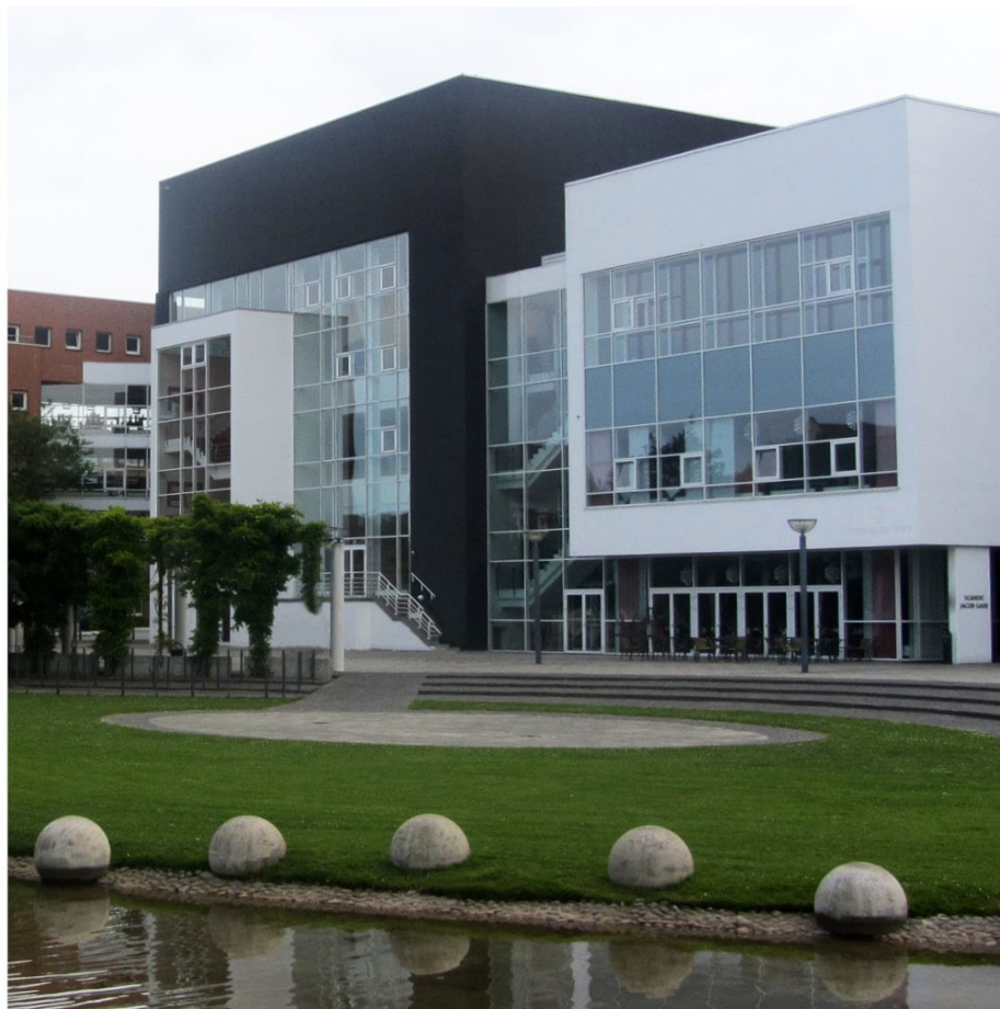
Kronprinsparrets Priser 2021.